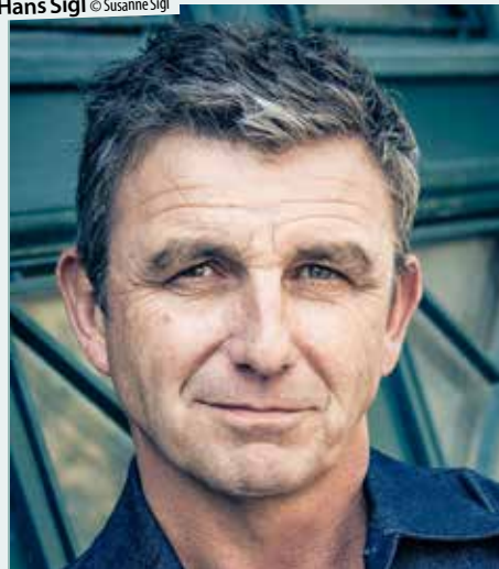
Hans Sigl