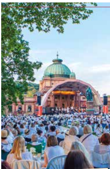
Klassiknacht in Weiß

Die Musiker garantieren Partystimmung mit Songs von Peter Fox, Bruno Mars, Imany, Rihanna, Dua Lipa, Ed Sheeran, Daft Punk, Katy Perry, Justin Timberlake und anderen Chartstürmern. 8,00 €.