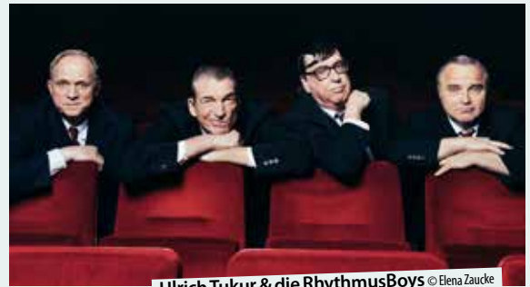
Ulrich Tukur &amp; die RhythmusBoys

UND SCHON EIN VORGESCHMACK AUF DAS 13. POESIEFESTIVAL: