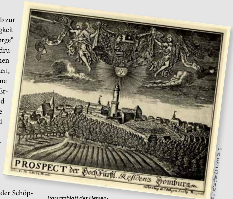
Vorsatzblatt des Hessen-Homburgischen Gesangbuches von 1734.

gezeichnet: Fr. Ph. Schulz, Homb.; gestochen: Ostertag u. Cöntgen.