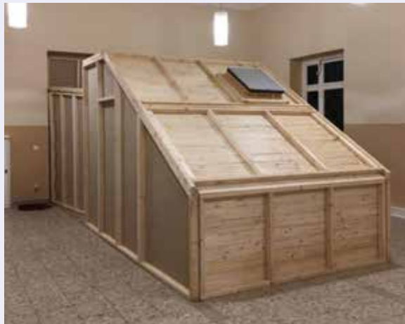
Skulptur von Isabell Ratzinger, HfG Offenbach

Unter der E-Mail-Adresse können auch kostenfreie Führungen für Kleingruppen gebucht werden.