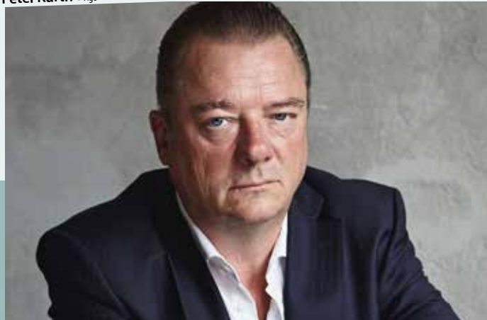
Peter Kurth © Agentur Schott+Kreutzer

Bereits gekaufte Tickets behalten ihre Gültigkeit, sie können aber auch an den Vorverkaufsstellen, an denen sie erworben wurden, zurückgegeben werden. Karten sind erhältlich: bei Tourist Info + Service im Kurhaus, Tel. 06172-178 3710, E-Mail tourist-info@kuk.bad-homburg.de , oder bei Frankfurt Ticket, Tel. 069-13 40 400 oder www.frankfurt-ticket.de .