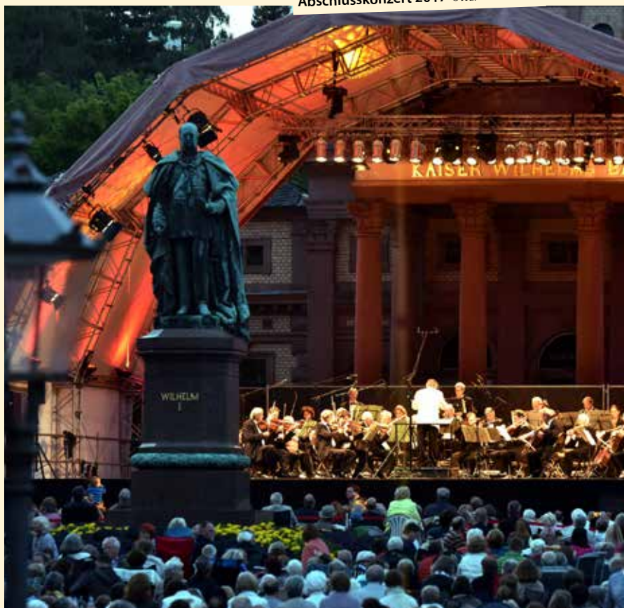
Johann-Strauß-Orchester Wiesbaden, Abschlusskonzert 2017

Der beliebte Klassiker zum Abschluss des Bad Homburger Sommers mit dem Johann-Strauß-Orchester Wiesbaden – in memoriam Herbert Siebert. 10,00 €.