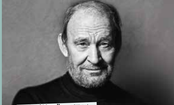
Michael Mendl

Samstag, 4. Dezember, 18.00 Uhr St. Marien-Kirche, Dorotheenstraße