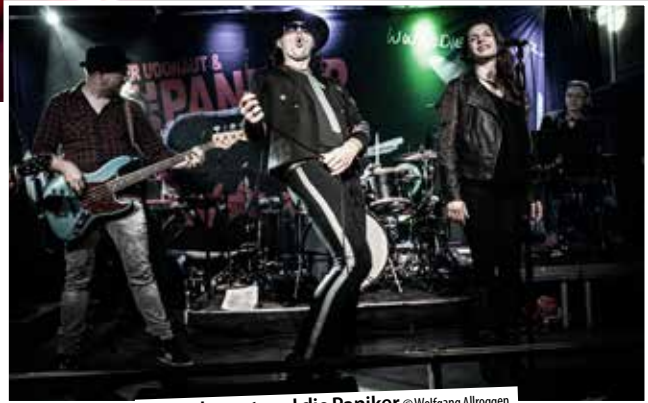
Der Udonaut und die Paniker © Wolfgang Allroggen