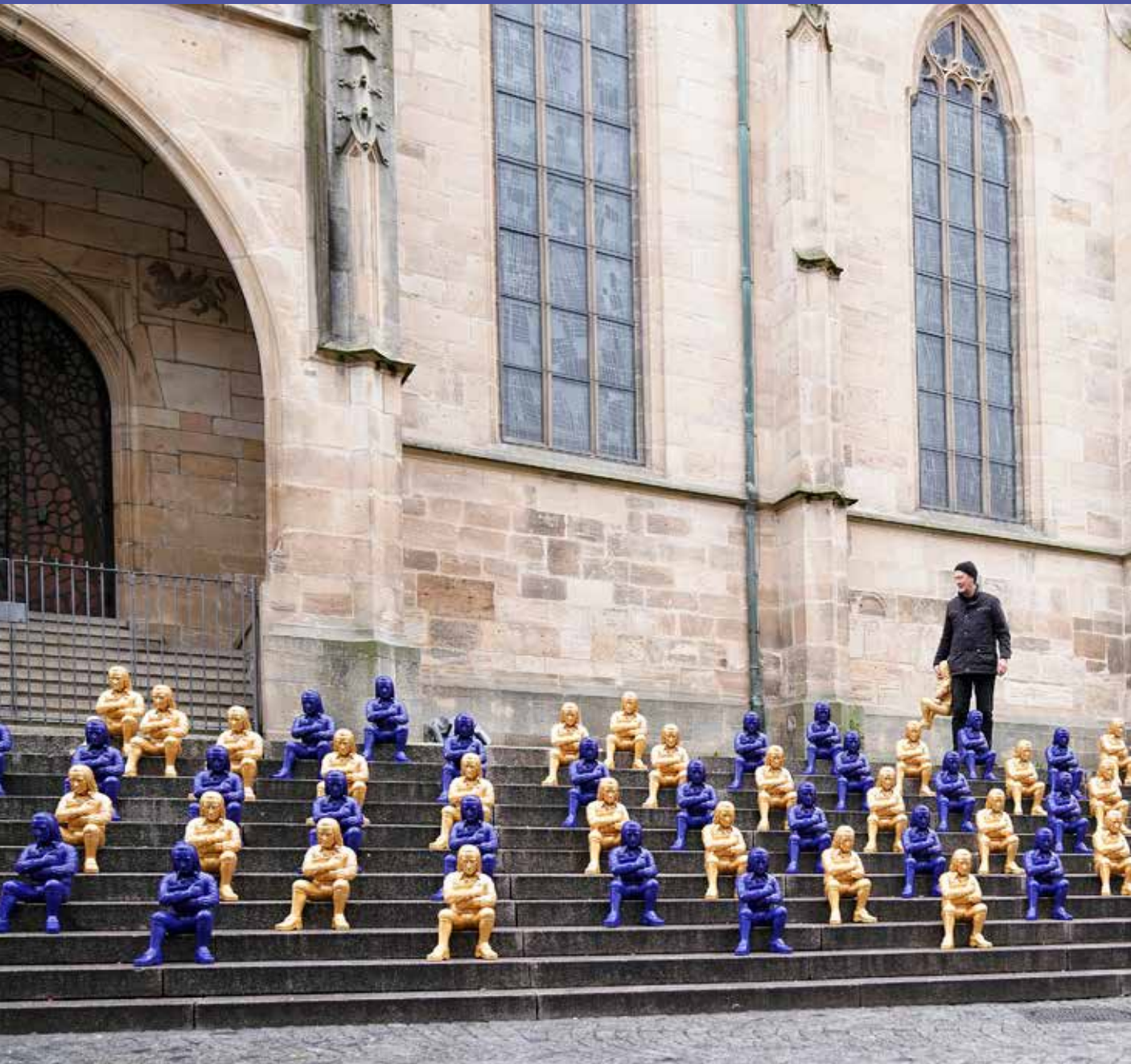
Ottmar Hörl, Skulptureninstallation „Pallaksch, Pallaksch!“, Tübingen, 2020, www.ottmar-hoerl.de .