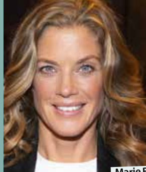
Marie Bäumer

Sonntag, 17. Oktober, 17.00 Uhr, Kurtheater