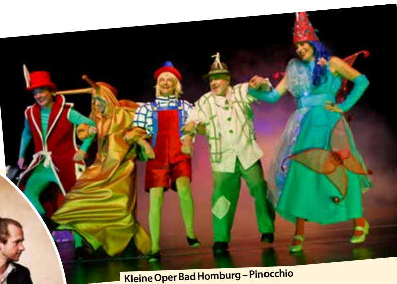
Kleine Oper Bad Homburg – Pinocchio

Für alle Veranstaltungen: Eintrittskarten bei der Tourist Info & Service im Kurhaus, bei Frankfurt Ticket Rhein-Main und an allen bekannten Vorverkaufsstellen.