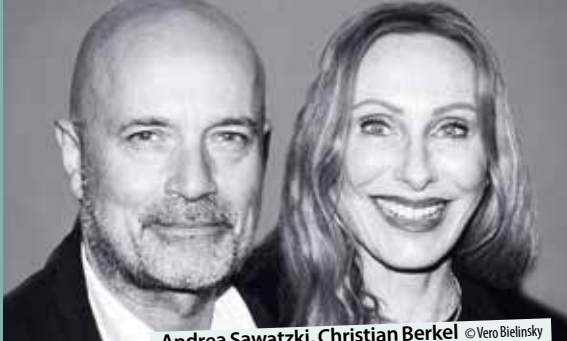
Andrea Sawatzki, Christian Berkel