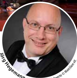
Jörg Hegemann © Fotostudio Dunke Schwertze © Moll-Stamm e.V.